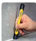
Hardy Szpachelka do silikonu 2090-500019