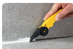
Hardy Skrobak do silikonu 2090-280018